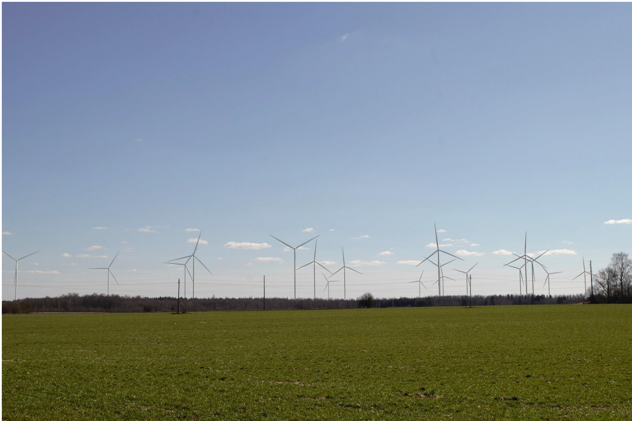
Joonis 2.2. Vaatekoht A – vaade Nurme külast Tuudi mõisa lähistelt (Tuudi-Risti teelt) lõunasse