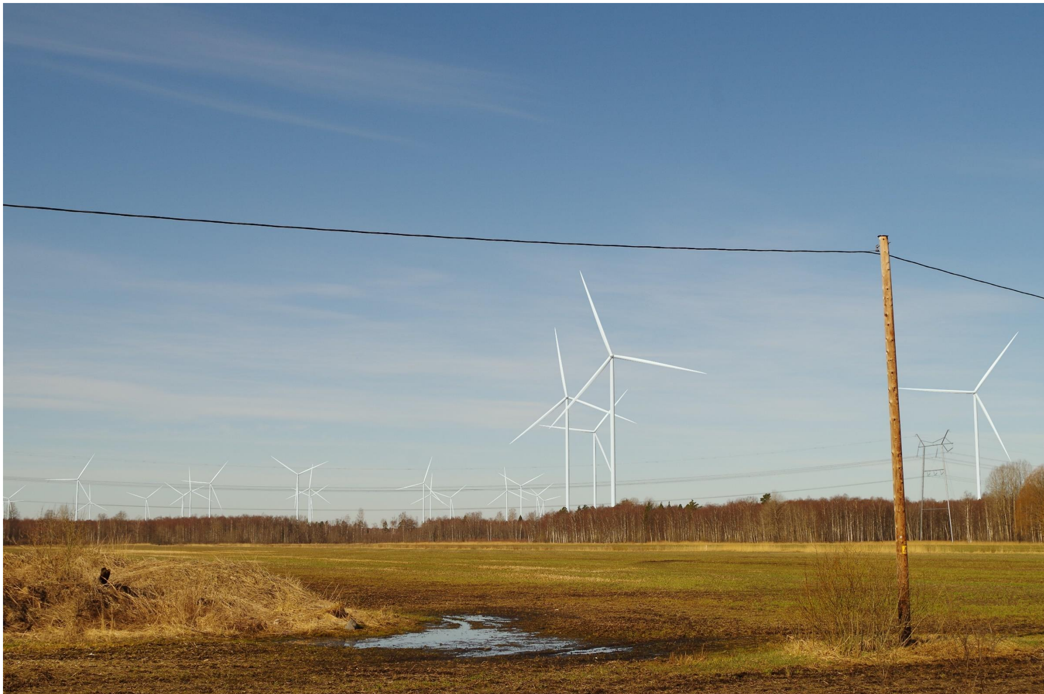
Joonis 2.7. Vaatekoht F – vaade Soovälja külast läänesuunas