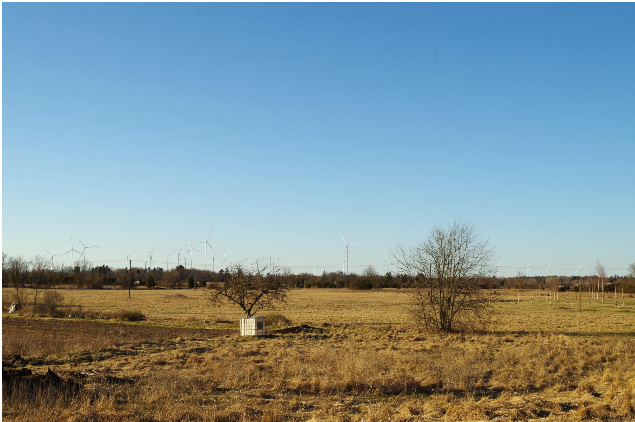
Joonis 2.5. Vaatekoht D – vaade Vatla külast (korterimajade lähistelt) põhjasuunas