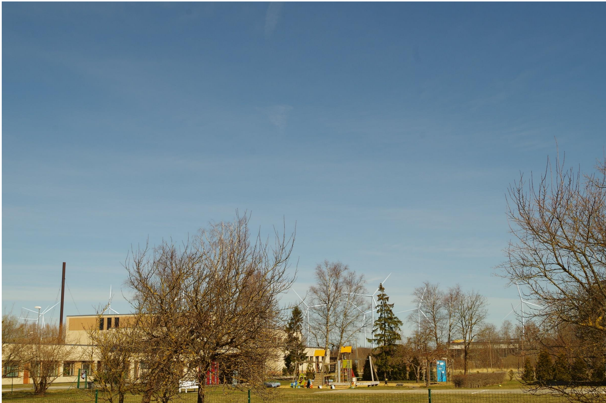
Joonis 1.5. Vaatekoht D – vaade Varbla kooli juurest kirdesuunas