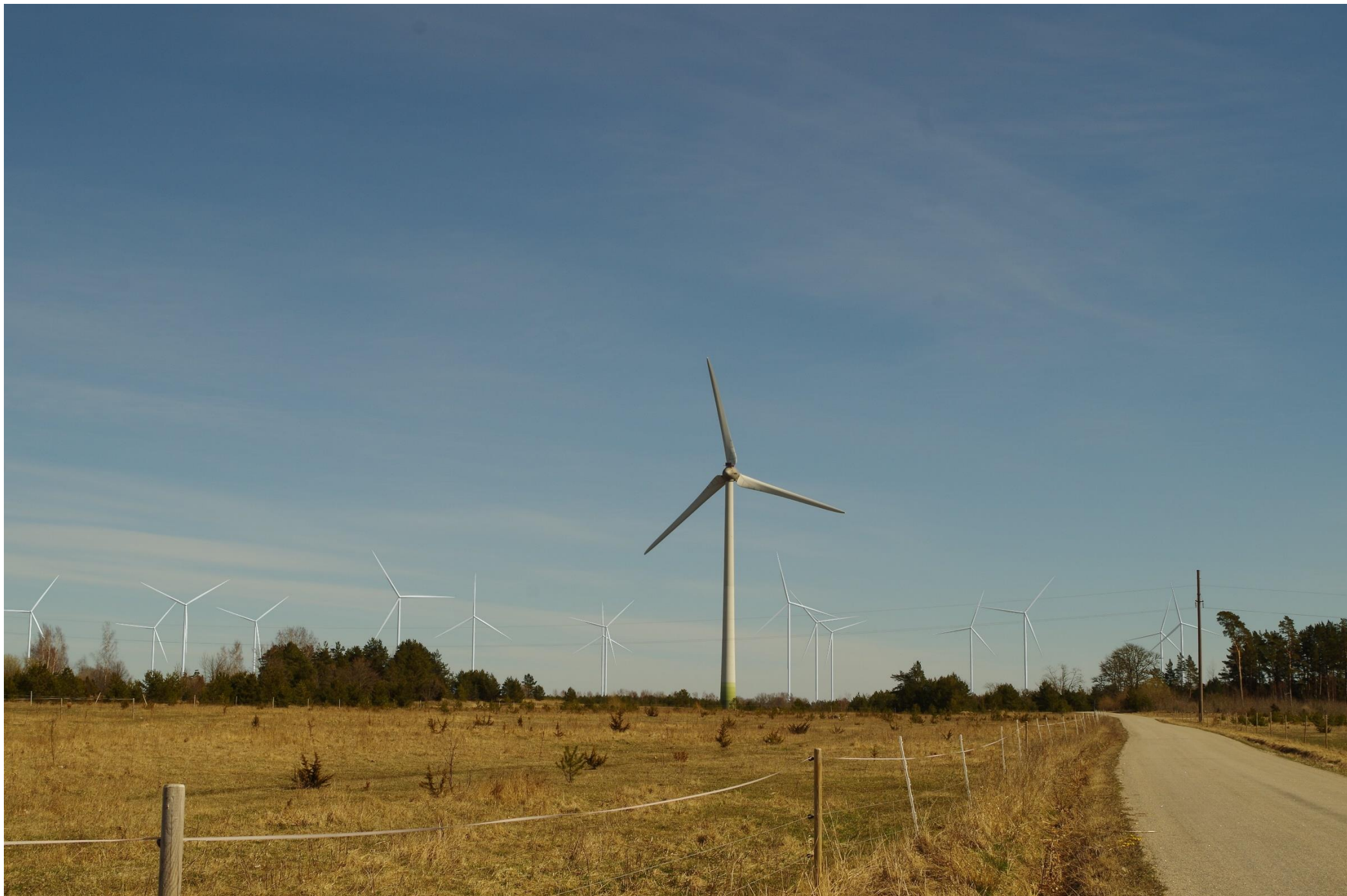
Joonis 1.4. Vaatekoht C – vaade Mälikülast kirde-ida suunas