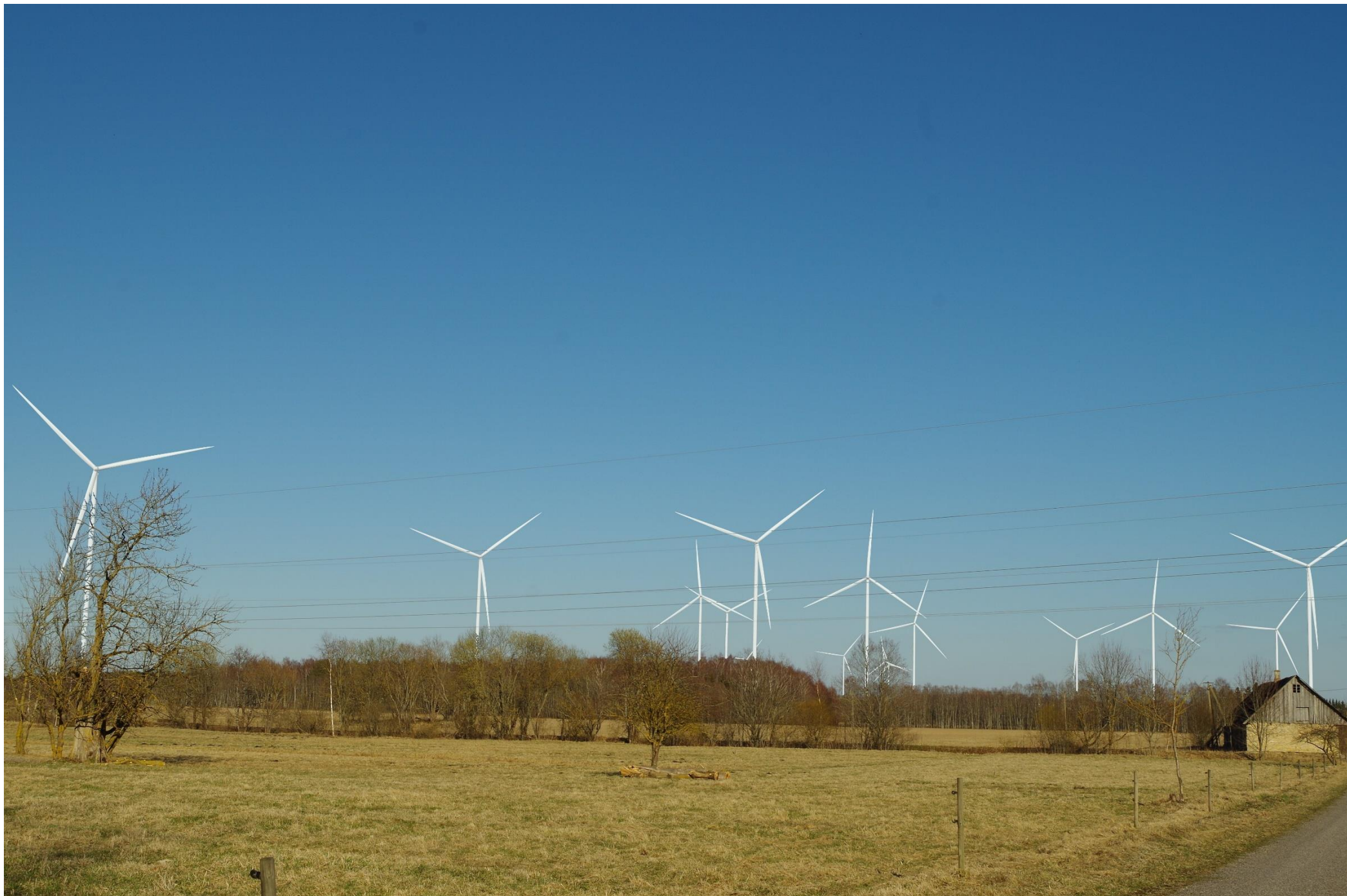
Joonis 2.4. Vaatekoht C – vaade Kinksi külast idasuunas