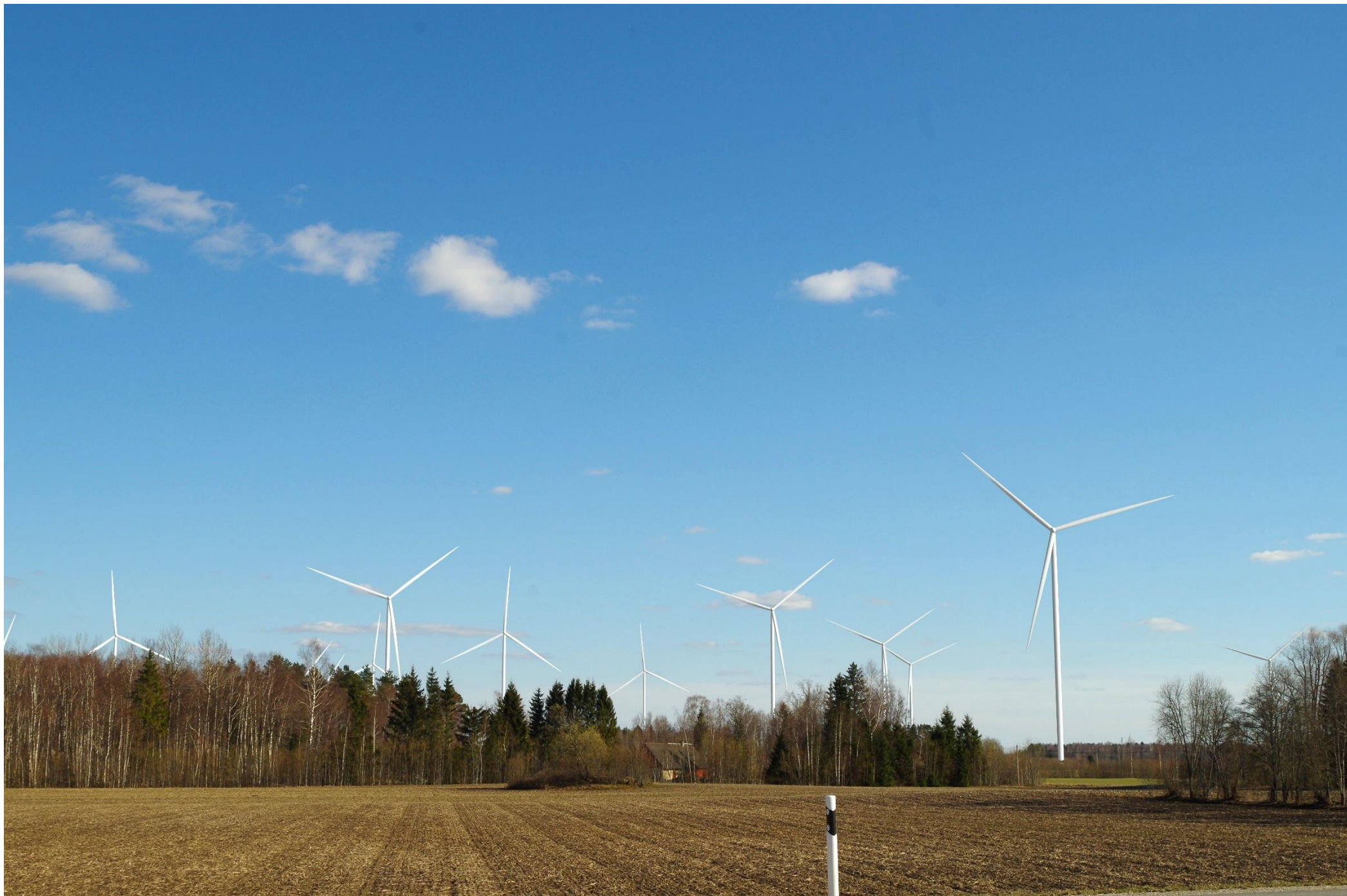
Joonis 2.3. Vaatekoht B – vaade Vagivere küla bussipeatusest kagusuunas