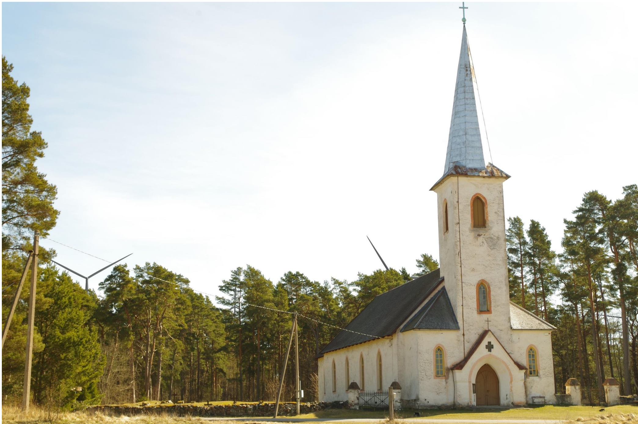
Joonis 1.2. Vaatekoht A – vaade Varbla kiriku juurest idasuunas