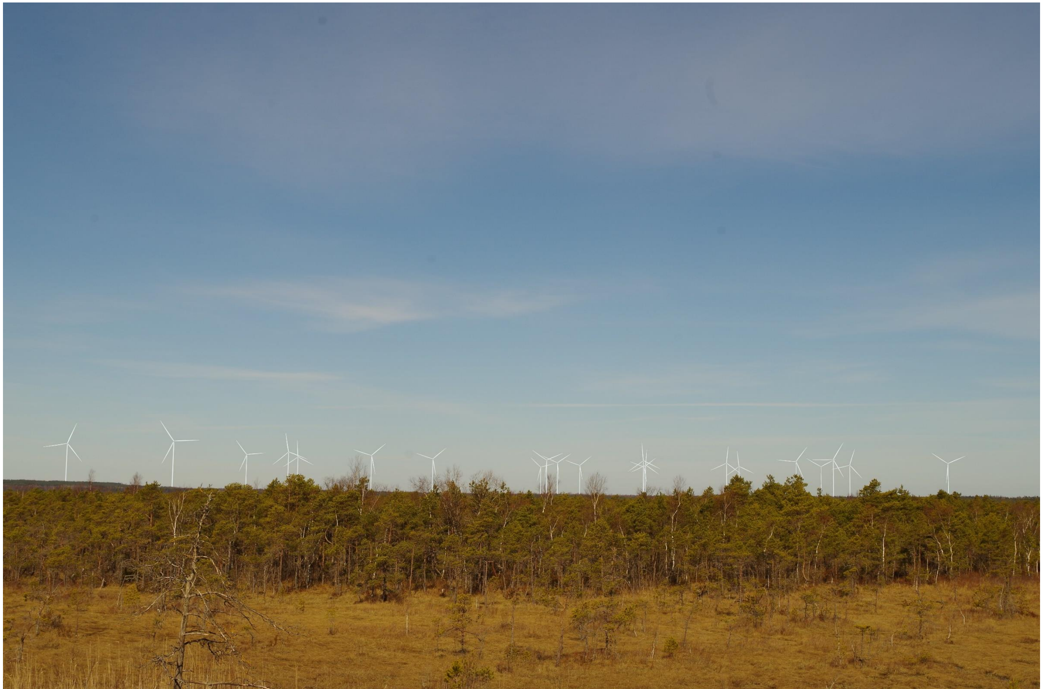
Joonis 2.6. Vaatekoht E – vaade Tuha soo vaatetornist loodesuunas (vaatetorni kõrgus 5 m)