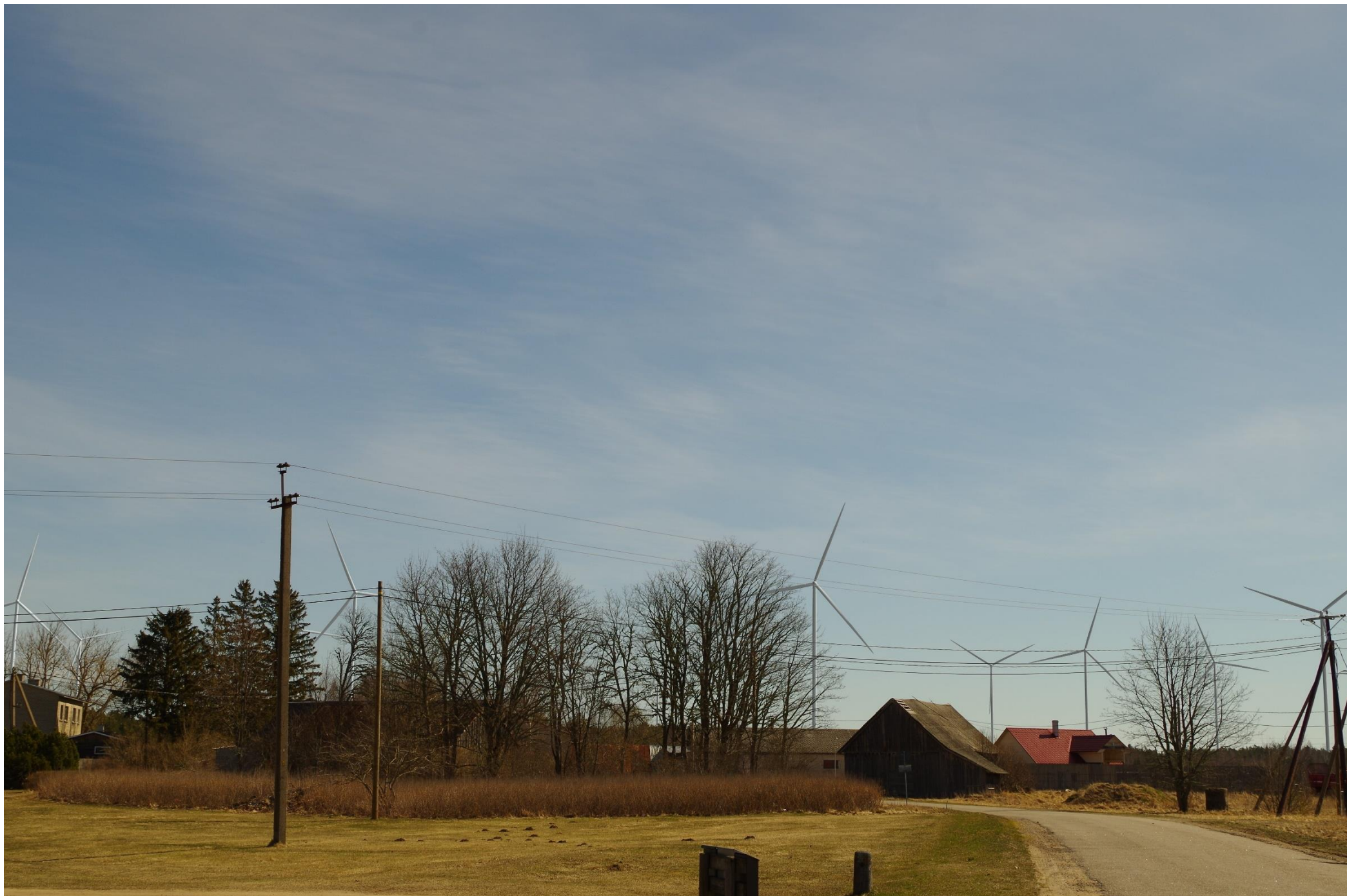
Joonis 1.3. Vaatekoht B – vaade Helmkülast (Audru-Tõstamaa-Nurmsi tee ja Varbla-Väänja tee ristmiku lähistel) idasuunas