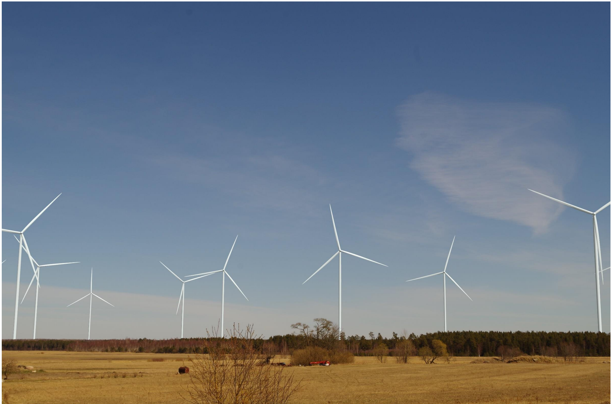
Joonis 1.6. Vaatekoht E – vaade Piha külast kirdesuunas